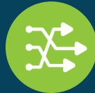
Forecasting & Procurement