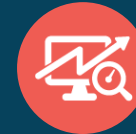
BI & Analytics